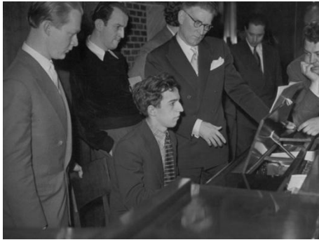
Vladimir Ashkenazy, 1956