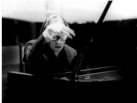
Valery Afanassiev, 1972